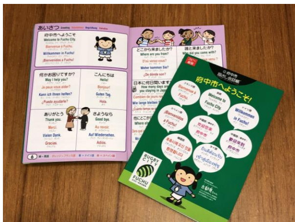
▲指さし会話帳（中学生・ボランティア向け）

市役所4階経済観光課、観光情報センター、国際交流サロン（市民活動センタープラッツ5階）、郷土の森観光物産館ほか ※在庫が無くなり次第、配布を終了します。